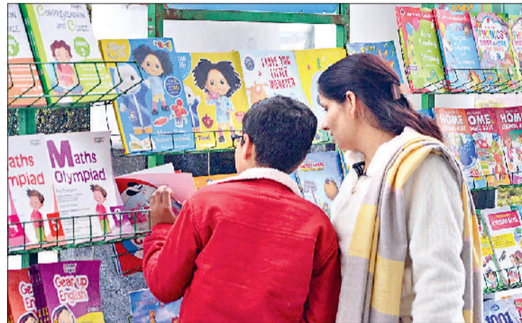
गन्नौर। पुस्तक मेले में अपने अभिभावक के साथ पुस्तकें देखता छात्र।