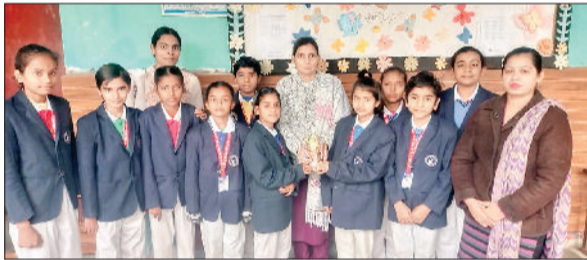
खरखोदा। विद्यार्थियों को सम्मानित करते प्राचार्य शिक्षक।