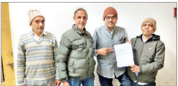
गन्नौर। सीएम विंडो पर की गई शिकायत की प्रति दिखाते दुकानदार।

शिव मार्केट गन्नौर के प्रवेश द्वार पर बना लैंटर जर्जर हालत में पहुंच चुका है, जिससे कभी भी बड़ा हादसा हो सकता है। स्थानीय दुकानदारों के अनुसार लैंटर का कुछ हिस्सा पहले भी टूटकर आने-जाने वाले लोगों पर गिर चुका है। इसके बावजूद अब तक इस हटाने की कार्रवाई नहीं की गई है, जिससे जनहानि की आशंका बनी हुई है। मार्केट के एक-दो दुकानदार कार्रवाई में बाधा डाल रहे हैं और लैंटर तुड़वाने नहीं दे रहे। स्थानीय दुकानदारों ने इस संबंध में सीएम विंडो पर शिकायत दे कर कार्रवाई की मांग की है।