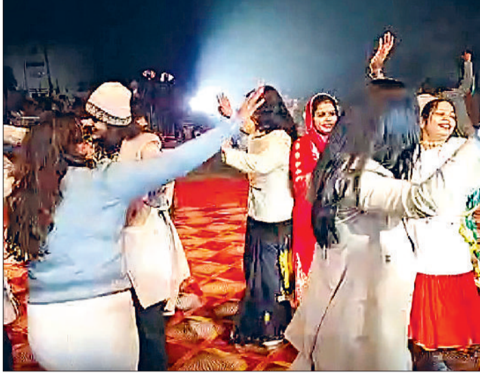
मुरथल में दिखी खास रौनक

नववर्ष-2026 के स्वागत को लेकर बुधवार शाम से ही सोनीपत जिले के शहरों, कस्बों और गांवों में उल्लास का माहौल छा गया। पुराने वर्ष को विदाई और नूतन वर्ष के इस्तकबाल के लिए लोगों ने पूरे जोश और उमंग के साथ जश्न मनाया। जैसे-जैसे रात गहरी गई, वेसे-वेसे खुशियों का रंग और भी चटख होता चला गया। शहर से लेकर मुरथल तक होटल, ढाबे और रेस्टोरेट 'हैप्पी न्यू ईयर' की गूंज से सराबोर रहे। नूतन वर्ष के आगमन से पहले ही केक, मिठाई, गुलदस्ता और बुके की दुकानों पर लोगों की भारी भीड़ उमड़ पड़ी। मित्रों, परिजनों और रिश्तेदारों ने एक-दूसरे को बधाइयां दीं। सोशल मीडिया पर भी शुभकामनाओं का सिलसिला देर रात तक जारी रहा। होटलों और रेस्टोरेटों को आकर्षक झालरों और बहुरंगी फूलों से सजाया गया था, जिससे पूरा माहौल उत्सवमय नजर आया।