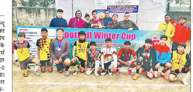
सोनीपत। विजेता खिलाड़ियों को ट्रॉफी देते हुए।