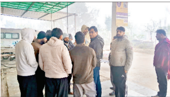
सोनीपत। हादसे के बाद अस्पताल में पहुंचे परिजन।